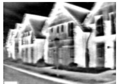
Wärmeverluste an Häusern

Ulrich Jander Arbeitsmedizinischer & Sicherheitstechnischer Dienst Rüsselsheim GmbH