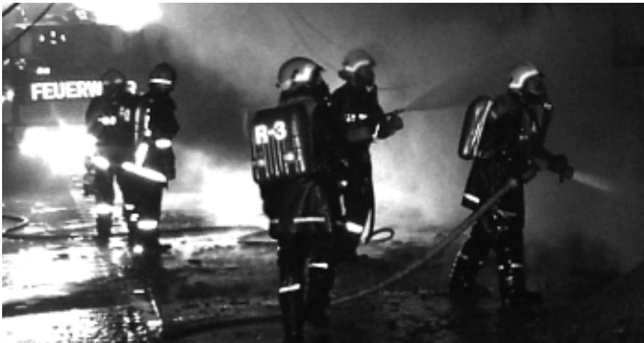
Löscheinsatz nach Abzug des Rauches

Einsatztaktik und Spezialausrüstung der Feuerwehren verhindern das Inferno