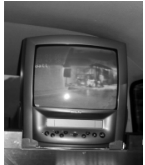
Einsatz wird mit WBK überwacht

Text: Josef Schwarzmann, Landesfeuerwehrverband Vorarlberg, Österreich