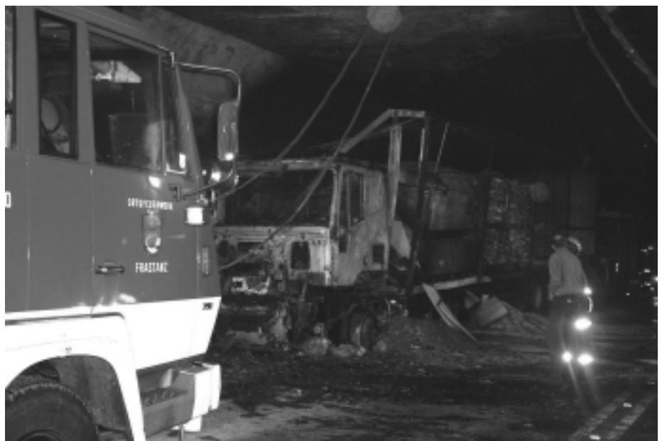
Wrack des ausgebrannten LKW