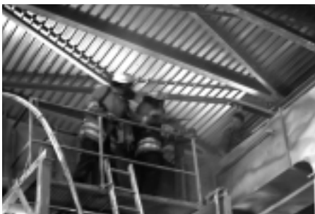
Lokalisierung des Brandherdes

Mitgeführt wird die Kamera wahlweise bei Überlandhilfeeinsätzen auf der Drehleiter oder GW- Messtechnik, bzw. auf dem LF 16/16 oder KdoW im eigenen Zuständigkeitsbereich.