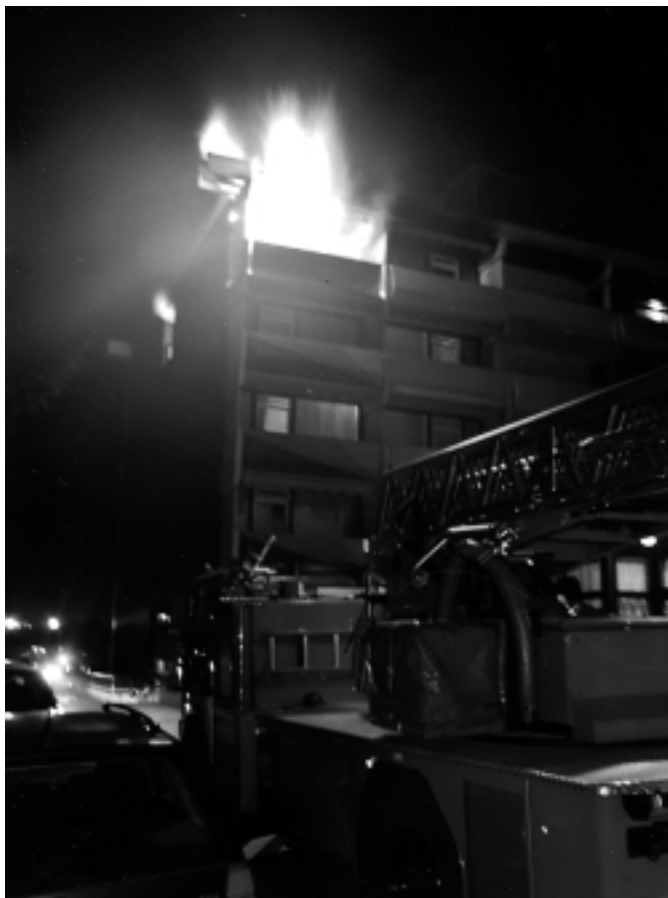
Hotelzimmer im Vollbrand

Freitag, 6.09.2002, 21:22 Uhr :Alarm für die Feuerwehr Bad Füssing. Starke Rauchentwicklung im Hotel „Schweizer Hof“. Beim Eintreffen des TLF 16 und der DL30 am Einsatzort stand ein Zimmer im vierten Stock des Gebäudes im Vollbrand. Die Flammen schlugen mehrere Meter hoch aus dem Fenster.