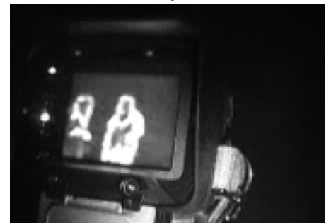
Übung mit der Wärmebildkamera

Als Schwerpunkt im regulären Dienstbetrieb 2003 wird die Handhabung der Bullard-