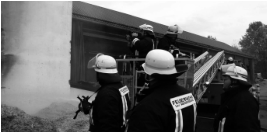
Der Löscherfolg wird mittels Wärmebildkamera überwacht

Am 21.10.2002, 11:36 Uhr, wurden die Feuerwehren Sulzbach (TSF), Donaustauf (MZF: LF 8; LF16/12), Lichtenwald (TSF), Demling (TSF) sowie KBM 3 zum Brand des Spänesilos bei der Fa. Donau-Holzschutz, im Ortsteil Sulzbach/Hammermühle alarmiert. Eine erhitzte Förderschnecke, welche Sägespäne in die Heizungsanlage der Schreinerei transportiert, hatte das annähernd volle Silo entzündet. Bereits auf der Anfahrt war von weitem Flammenschlag aus dem unteren Silotor sowie aus den